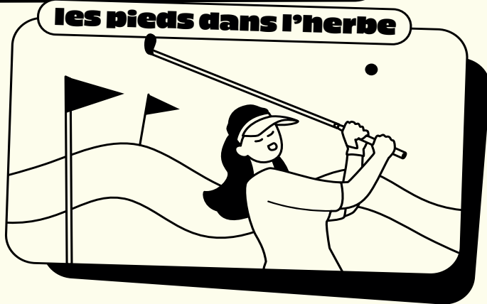
Illustration : Nans Delpeiro