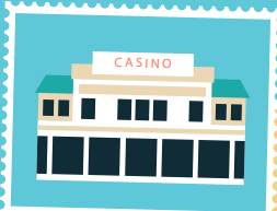
La belle époque