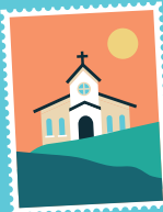
Les églises romanes