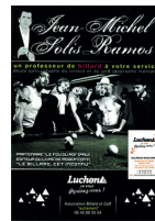
COURS DE BILLARD Luchon