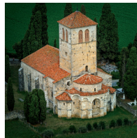
VISITE BASILIQUE Valcabrière