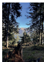
SORTIE NATURE AVEC L'ONF