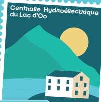
TARIFS & HORAIRES

Découvrez l'ensemble des visites guidées proposées par l'office de tourisme Pyrénées 31 sur pyrenees31.com/agenda