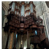
VISITE SECRÈTES St-Bertrand-de-Comminges