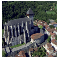
VISITE CATHÉDRALE St-Bertrand-de-Comminges