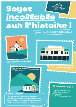
LES SORTIES DE NATHALIE Tout le territoire